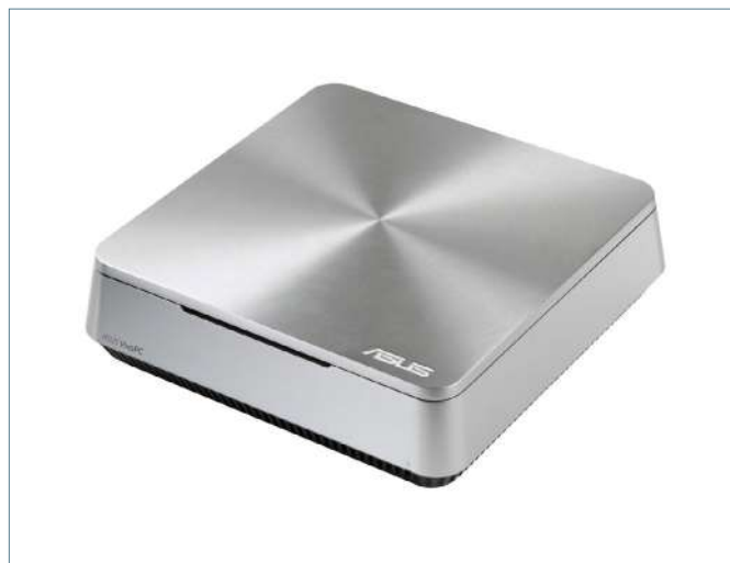
ASUS VivoPC VM40B (OPTIONNEL)